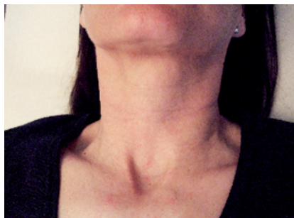
Esito dopo 4 sedute – visione frontale

Al di là del caso evidenziato, (che peraltro rappresenta un grosso successo se si pensa alla complessità nell'ottenere un risultato di questa portata in una zona così ostica da trattare), la radiofrequenza è un trattamento estremamente valido anche sul corpo.