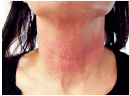
Rossore immediatamente successivo al 1° trattamento