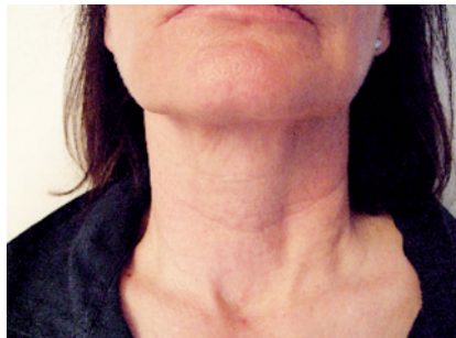
Evidente risultato dopo 2 trattamenti, a distanza di 15 giorni

ca 30 minuti. Le sedute effettuate, con cadenza quindicinale, saranno in totale 4. Al termine della singola seduta viene applicato un sottile strato di crema lenitiva, ma la paziente, il cui lieve rossore è destinato a scomparire nell'arco di 4-6 minuti, può continuare la propria vita sociale.