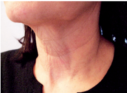
Visione laterale pre-trattamento