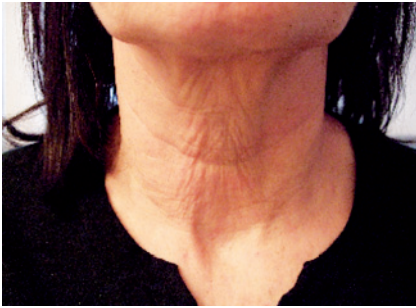
Visione frontale pre-trattamento