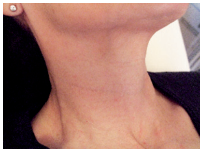
Esito dopo 4 sedute – visione laterale

Sebbene con risultati meno rapidi, lavorare con questo sistema in zone quali l'addome, l'interno coscia, l'interno braccia, la zona periom-